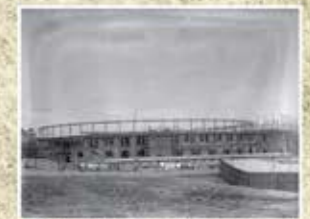
Construcción de Las Ventas