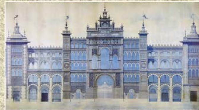
Plano original de la plaza de Las Ventas diseñada por José Espeliú