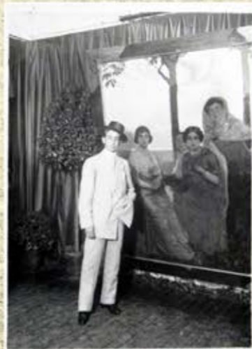
La única foto que existe de Joselito "junto" a Guadalupe. Es 1917, el torero posaba ante un lienzo del pintor Miguel Ángel del Piro y Sarda donde aparecían retratadas las tres hijas de Felipe de Pablo-Romero.