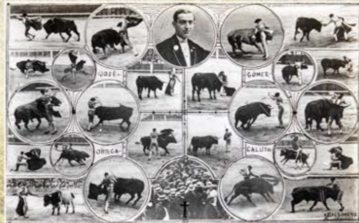
Mezclas recueltas de Rodero, Cervera y Baldomero