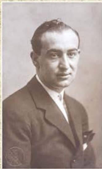
Diversas fotos de Joselito tomadas en 1920, el año de su muerte. Acababa de cumplir los 25.

Manuel Chaves Nogales (Juan Belmonte, matador de toros)