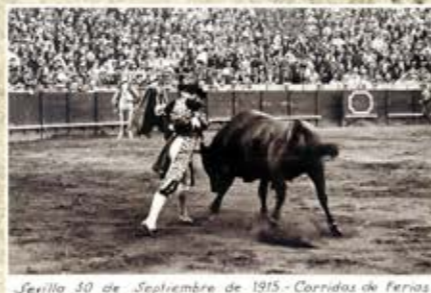
Sevilla 30 de Septiembre de 1915 - Corridos de Ferias

Joselito entre La Maestranza y La Monumental