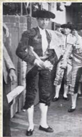
Gallito de luto en 1919